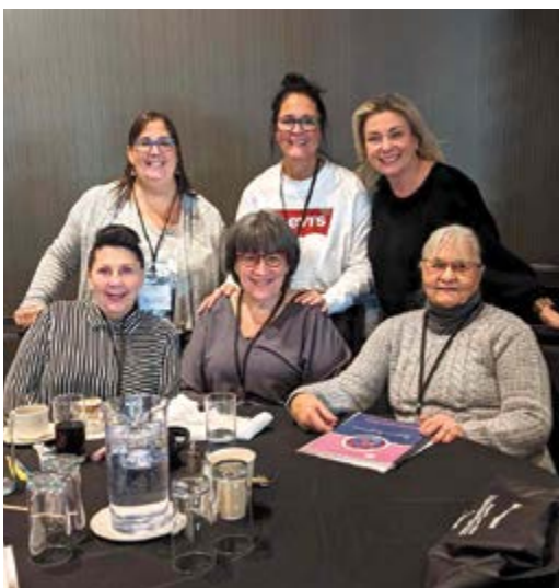
Absente de la photo Thaya Lachapelle