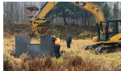
Photo 1. La plaque permettant d'augmenter le niveau d'eau juste avant son installation.

Si vous avez envie de participer à cette activité de plantation ou que vous êtes curieux de venir visiter cet aménagement afin de venir poser des questions, vous êtes les bienvenus! Contactez-nous au BETO!