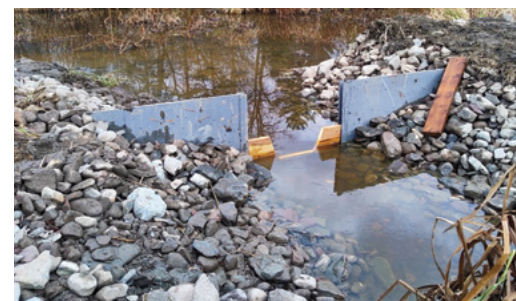
Photo 2. Déversoir installé et premier test de contrôle du niveau à l'aide de planche.