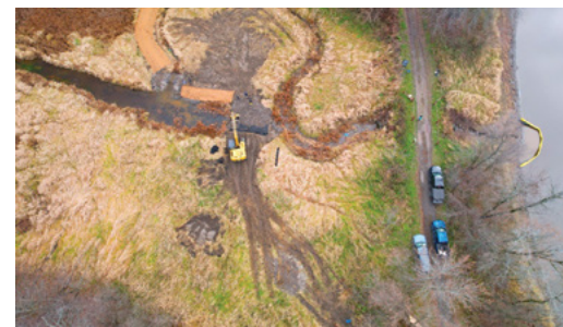
Photo 3. Photo aérienne des travaux réalisés dans le marais #2 d'Odanak.