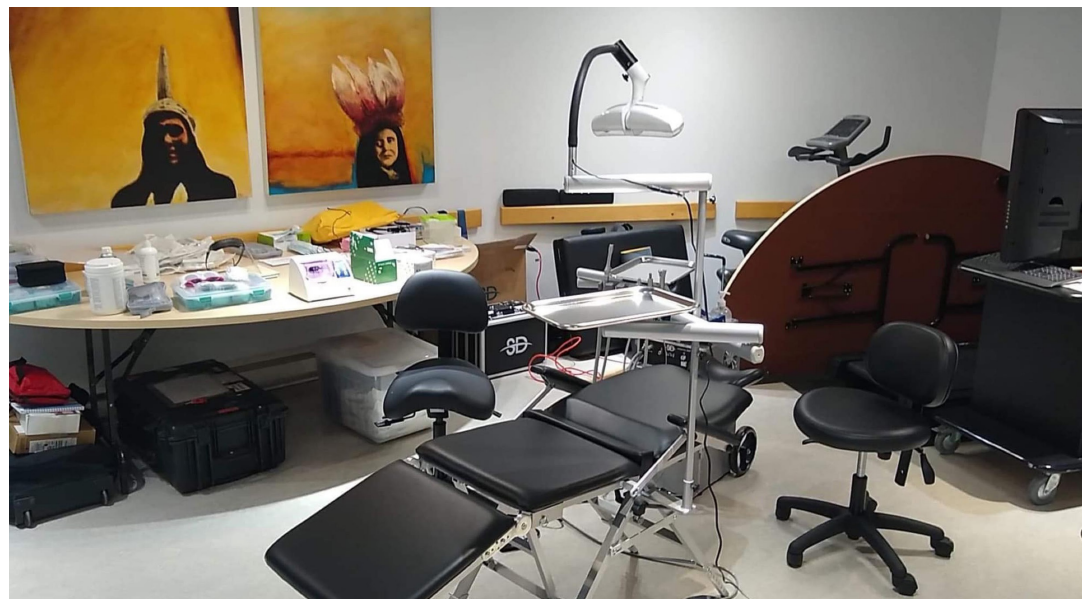
Salle de conférence du Centre de santé d'Odanak lors des journées d'application d'agent de scellement des puits et fissures lors de la semaine de relâche.

Hygiéniste dentaire - Centre de santé d'Odanak