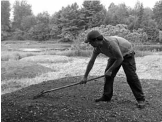
Environnement et Terre d'Odanak