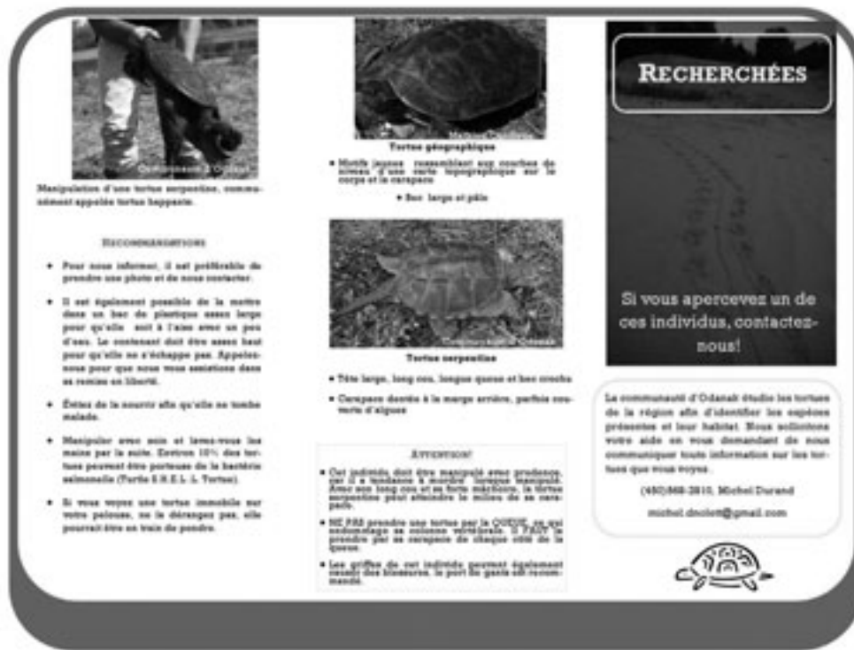
Figure 4. Extrait du dépliant éducatif distribué dans la communauté d'Odanak afin de sensibiliser la population et d'obtenir des renseignements sur la présence des différentes espèces.

huit nids de tortue peinte ont été identifiés, dont deux ont été protégés par un grillage. Les œufs des six nids non protégés ont été récoltés car ils étaient dans des zones menacées par la circulation et la compaction du sol. Sur 31 œufs incubés, 25 ont éclos et les jeunes tortues ont été relâchées le printemps suivant au 1 er marais. La même année, sept faux nids de tortues peintes et trois de tortues serpentine ont été trouvés, ainsi que deux nids saccagés par des prédateurs non identifiés. Le marquage de six nids au site de ponte principal a également permis de constater que malgré la présence d'activités humaines, le taux d'éclosion avait été de plus de 90 %. En 2008, quatre nids de tortues serpentine y ont été trouvés et aucun n'a été détruit par des prédateurs. La prédation des œufs par des carnivores, tels que le raton laveur ( Procyon lotor ), le renard roux ( Vulpes vulpes ) ou la mouffette rayée ( Mephitis mephitis ), a semblé modérée au cours de ces deux années.