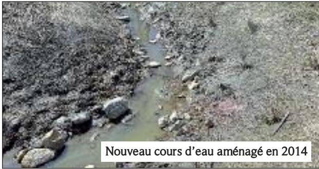
Nouveau cours d'eau aménagé en 2014

L'été dernier, le ruisseau reliant la rivière Saint-François au 1 er marais de la commune a été réaménagé. Ce projet visait principalement à