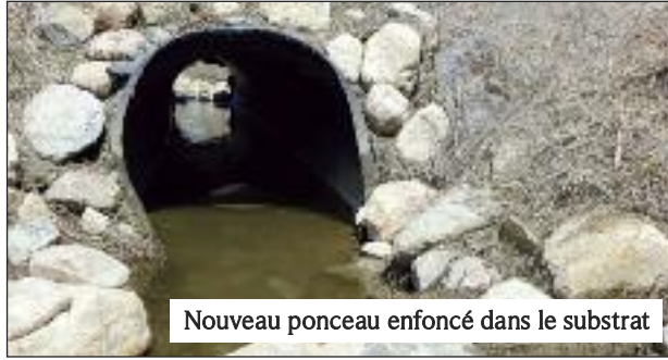
Nouveau ponceau enfoncé dans le substrat

redonner accès au marais à la perchaude puisque ce marais était anciennement un bon site de reproduction et de croissance pour ce poisson. Plusieurs facteurs combinés, dont la diminution de la hauteur des crues, un ponceau inadéquat et le creusement avec le temps du ruisseau, ne permettaient plus au poisson d'atteindre le marais. C'est pourquoi en juillet 2014, un nouveau cours d'eau plus long et moins abrupt accompagné d'un nouveau ponceau enfoncé dans le fond du cours d'eau ont remplacé l'ancien cours d'eau rectiligne et le ponceau désuet. Les pentes du nouveau cours d'eau ont aussi été aplanies et stabilisées par des végétaux.