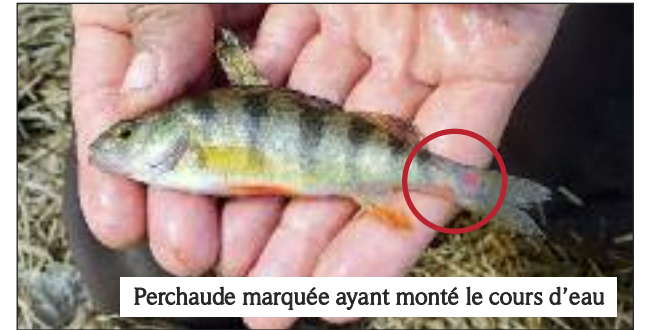
Perchaude marquée ayant monté le cours d'eau

avant d'être recapturés à l'entrée du marais. De plus, une trentaine de petites perchaudes provenant du marais ont descendu le nouveau ruisseau durant cette même période. Ces perchaudes ont fort probablement été produites le printemps passé, ont passé l'hiver dans le marais et regagnent maintenant la rivière Saint-François et le lac Saint-Pierre.