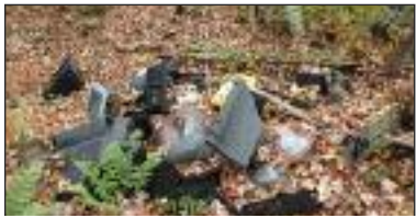
Dépotoir dans un boisé d'Odanak