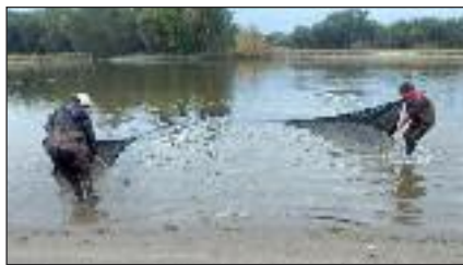
Pêche à la seine

nous intéresser à cette espèce. C'est pourquoi nous avons réalisé cinq jours de pêche à la seine (un filet pour pêcher le méné) sur toutes les plages de sable présentant un bon potentiel pour le dard de sable dans la rivière Saint-François, de l'embouchure jusqu'à Drummondville. Nous avons fait de très belles découvertes! En effet, nous avons trouvé ce poisson dans huit emplacements de la rivière et dans pratiquement tous les secteurs présentant un bel habitat. Nous savons maintenant que le dard de sable est bel et bien toujours présent dans la rivière Saint-François, principalement sur les plages de sable près de la marina de Saint-François-du-Lac ainsi que dans les zones sablonneuses des îles de Pierreville. Toutes ces précieuses informations recueillies cet été par notre équipe seront transférées aux gestionnaires de la faune afin de mettre à jour leurs données sur l'espèce et de soutenir son rétablissement au Québec.