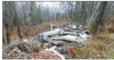
Déchets accumulés sur un terrain du Conseil