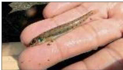
Dard de sable adulte