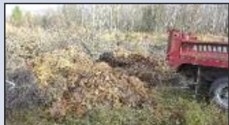
Collecte de feuilles mortes d'Odanak. Photo de la 1 re collecte de novembre.