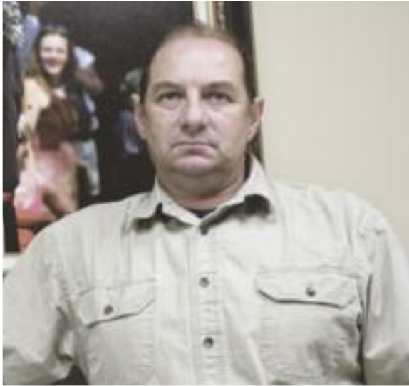
Kwai, Membres de la Bande,

C'est avec grand honneur que je m'engage à entreprendre le mandat de représenter notre Nation une fois de plus et pour les deux prochaines années. Plus que les bulletins de vote de la dernière élection, ce qui m'importe est le