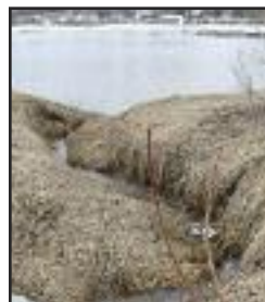
1 er marais de la commune avant aménagement

Au printemps dernier, nous vous avons parlé d'un nouveau projet visant le retour de la perchaude dans le 1 er marais de la commune par la construction d'aménagements fauniques. Rappelons-nous qu'en raison de l'effondrement de la population de Perchaude du lac Saint-Pierre, un moratoire interdisant toute pêche est en vigueur et seuls les Abénakis peuvent aujourd'hui pêcher ce poisson dans notre secteur. Cet effondrement est principalement associé à la perte d'habitat de qualité de reproduction et de croissance des petites perchaudes.