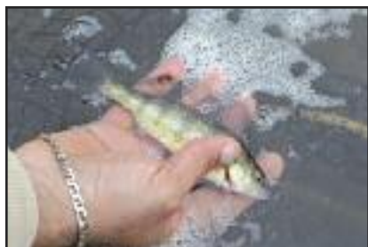
Perchaude capturée dans le verveux du 1 er marais