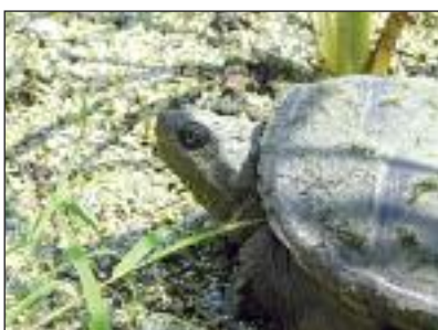
Tortue serpentine observée sur le territoire d'Odanak