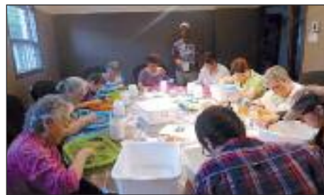
Recherche de larves d'esturgeons