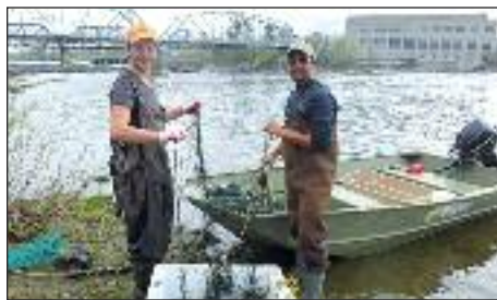
Pêche à l'esturgeon