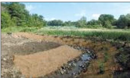
Nouveau cours d'eau

Nous sommes heureux de vous annoncer qu'une étape importante du projet Perchaude a été accomplie cet été. En effet, un nouveau cours d'eau reliant la rivière Saint-François au premier marais de la commune d'Odanak a été aménagé afin d'aider le passage des poissons. Rappelons-nous que ce projet a comme objectif de favoriser le passage des perchaudes